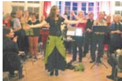
Im Januar begeisterte der „Popsongchor“ das Publikum mit einem populären Mitsingkonzert

Informationen: Mademann, Tel. 401 94 22.