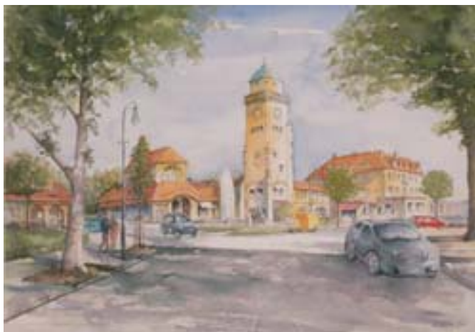
Werner Kulbe, „Ludolfingerplatz mit Kasinoturm“ Aquarell, 2011, 36 x 51 cm

Kontakt Werner Kulbe: Tel. 030/40 10 36 11